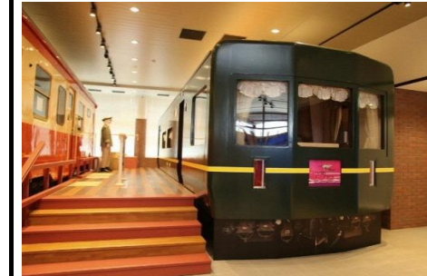
観光交流センター拡充