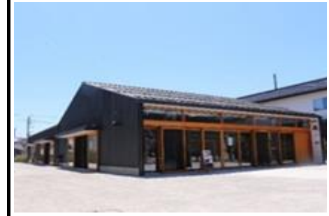
駅北広場キターレ