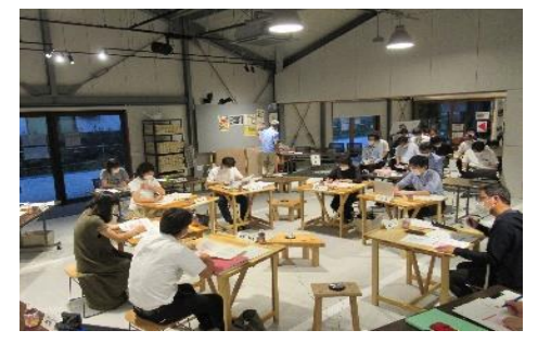
にぎわい創出人材育成事業