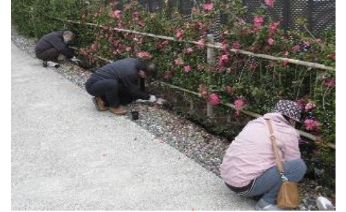
花いっぱい推進事業